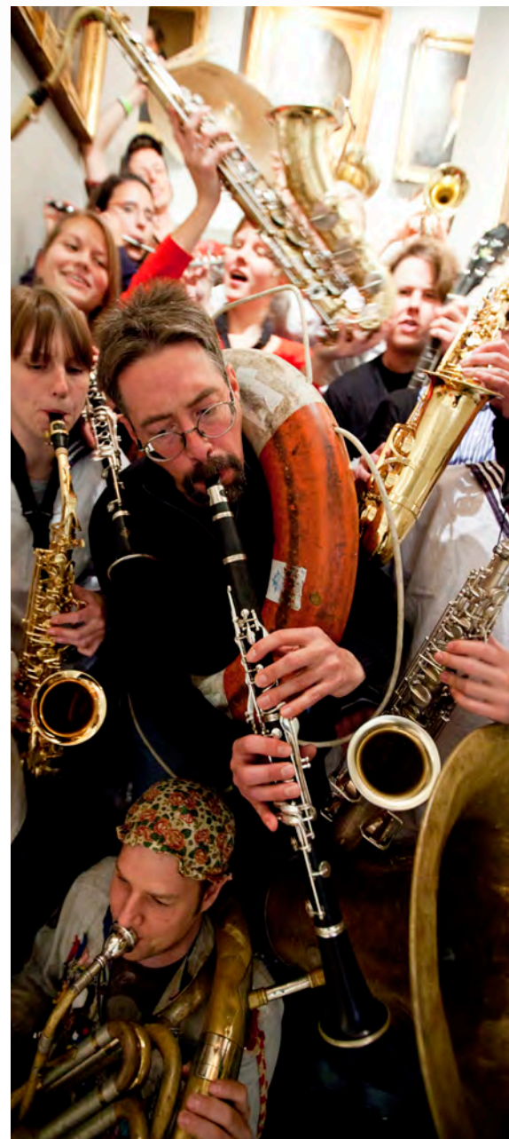
Wijkmanska Blecket brukar kallas Uppsalas mest studentikosa orkester.

TEXT: ANNICA HULTH, FOTO: MIKAEL WALLERSTEDT